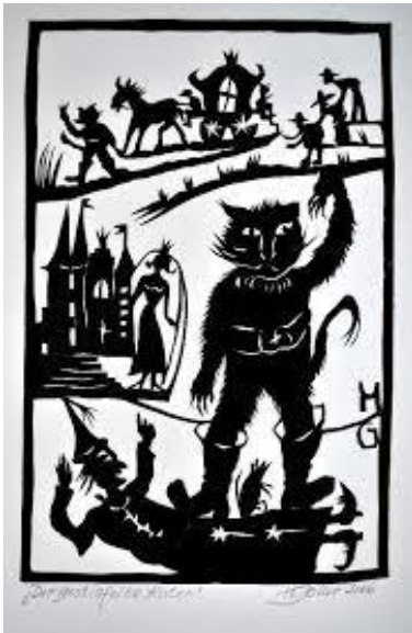
2. Le Maître Chat ou le Chat botté