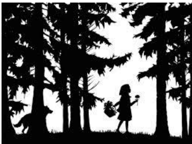
3. Le Petit Chaperon rouge