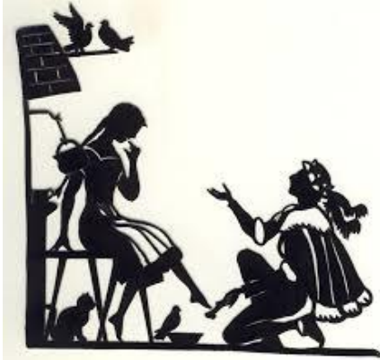
1. Cendrillon ou la Petite Pantoufle de verre

Wie heißen die deutschen Titel der folgenden Märchen? Die Illustrationen helfen euch. Notiert die deutschen Titel auf eurem Zettel.